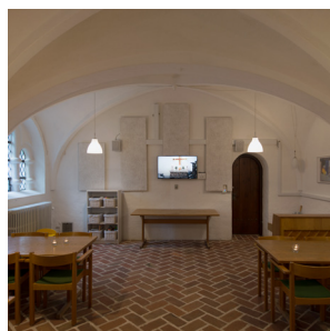
Skærm i krypten

Du er meget velkommen til at kontakte os for rådgivning eller et uforpligtende tilbud på tlf. 3917 7400 eller mail til mail@oticon.dk